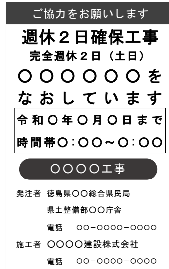
(標示板記載例) 完全週休2日(土日)の場合